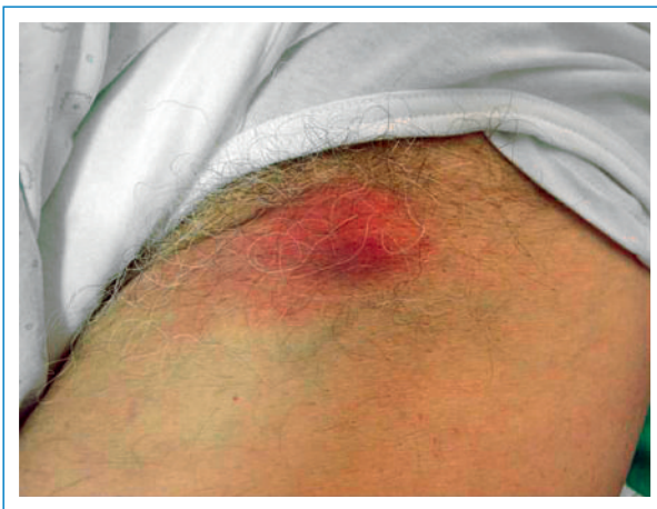
Figure 1 Tuméfaction inguinale gauche apparue une semaine après un traitement par amoxicilline-clavulanate.

bactéries appartenant à la flore oropharyngée ou cutanée de l'animal. Ainsi, on reconnaît les infections par Bartonella et Francisella tularensis dues aux chats et les infections par Capnocytophaga canimorsum transmises par les chiens [2–4]. Toutefois, une des seules grandes études prospectives pratiquées dans ce domaine avait montré que dans la plupart des cas les patients présentaient une infection mixte liée à des germes aérobies ou anaérobies typiquement présents dans la salive des animaux [5]. Cette étude concluait à la nécessité de traiter de manière empirique toutes les plaies secondaires à une morsure par animal domestique avec une antibiothérapie qui pouvait couvrir à la fois des espèces de type streptocoque et staphylocoque, les anaérobies mais aussi les germes de la