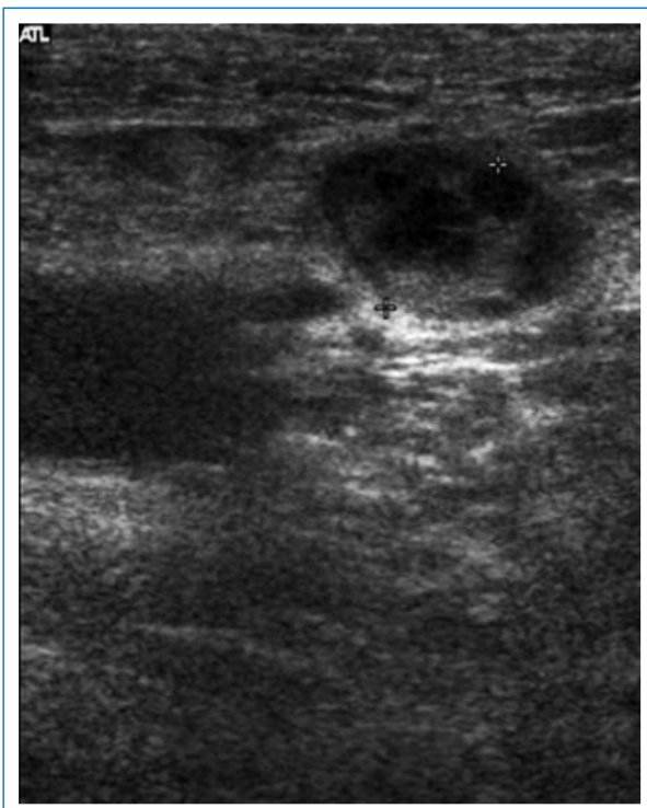
Figure 2 Ultrasonographie de la région inguinale gauche montrant une collection liquidienne entourée de quelques adénopathies à proximité de l'artère fémorale.

famille de Pasteurella . Dans notre observation, la particularité consiste dans le fait que la blessure infligée par le chat du patient a transmis à la fois une infection bactérienne de type salivaire liée à un streptocoque et simultanément une infection spécifique liée aux blessures infligées par le chat à savoir une infection à Bartonella henselae . Cette deuxième infection n'a pas été évoquée dans un premier temps, d'une part parce que l'anamnèse incomplète ne laissait pas suspecter ce type de pathologie et d'autre part nous avons assisté à une évolution rapidement favorable sous un antibiotique inefficace contre les bartonelloses mais efficace contre les infections à streptocoque. On a de même évoqué l'hypothèse que la présence de streptocoques non identifiables dans les hémocultures pouvait correspondre à une contamination. Cette hypothèse est toutefois peu probable, d'une part parce que le germe était présent dans deux bouteilles sur quatre et d'autre part parce que l'évolution clinique favorable sous amoxicilline-clavulanate rend fortement probable une participation de ce germe au tableau inflammatoire. Il est possible aussi que le temps d'incubation, différent pour les deux infections, ait joué un rôle dans l'évolution clinique en deux temps.