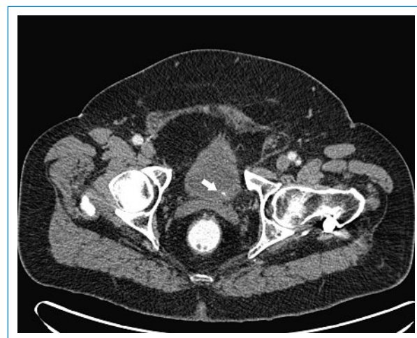
Abbildung 2 CT Abdomen axial: Pfeil zeigt auf Ureterkonkrement.