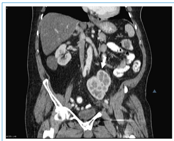
Abbildung 1 CT Abdomen, koronare Rekonstruktion: Pfeil zeigt auf Beckenniere.