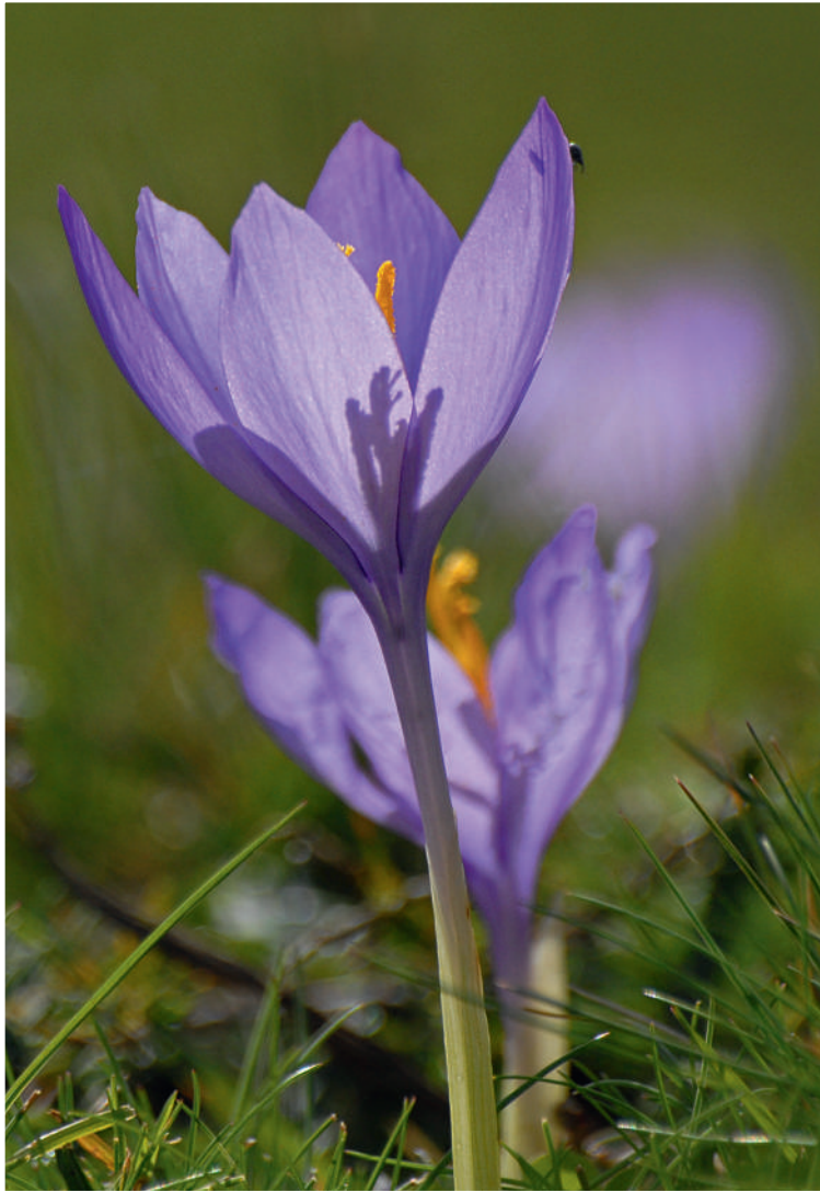
Figure 1 La colchique d'automne ou le tue-chien (avec la permission de Jackie Fourmiès).

Il est possible que la présence d'une dysfonction rénale préalable dans le cadre d'un diabète de type 2 et d'une HTA prédispose à une fragilité accrue des cellules tubulaires à une nécrose. La combinaison de plusieurs mé-